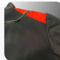
Rejilla espalda transpirable 3D